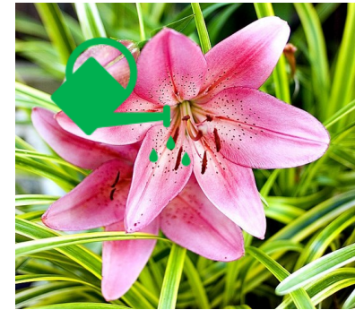
UN LIS A LILY