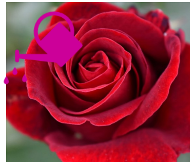
UNE ROSE A ROSE