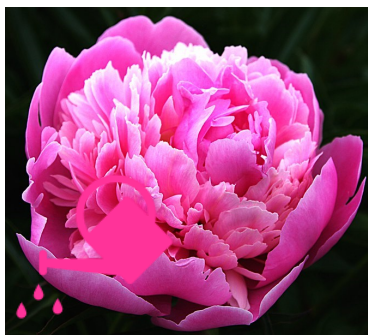
UNE PIVOINE A PEONY