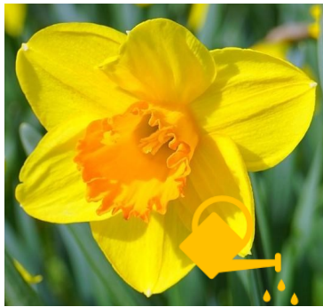
UNE JONQUILLE A DAFFODIL

Find the hidden watering can in each flower ! Cherchez et trouvez l' arrosoir caché dans chaque fleur !