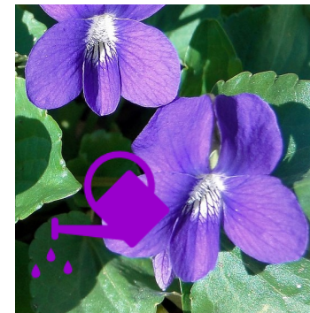
UNE VIOLETTE A VIOLET